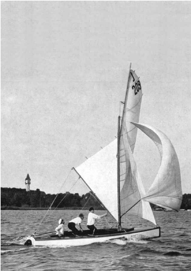
Damals: ...Seglerhauspreis 1928 auf dem Wannsee