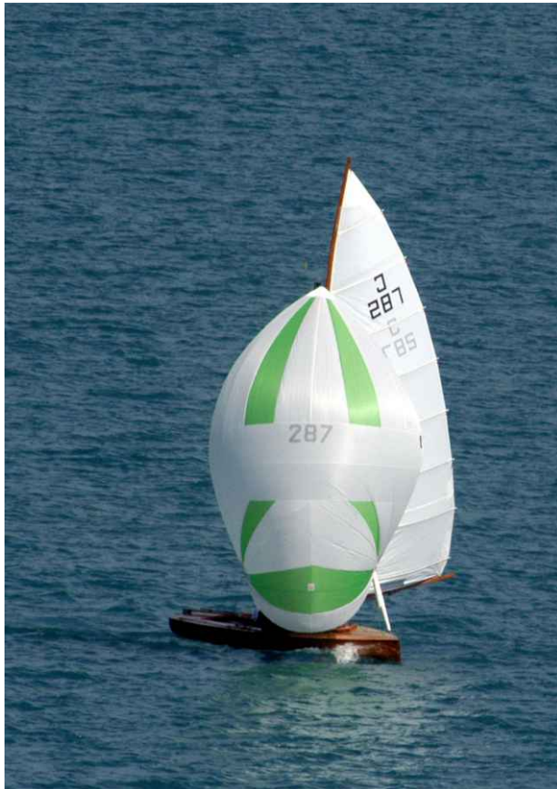
22qmRJ FRAM KDrewitz 1924

Heute: ...Europa Pokal 2006 auf dem Attersee